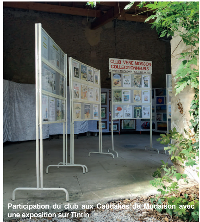
Participation du club aux Caudalies de Madaison avec une exposition sur Tintin

Une belle saison de projets et d'expositions se termine pour le club qui prépare déjà la rentrée en étant présent à la journée des associations début septembre.